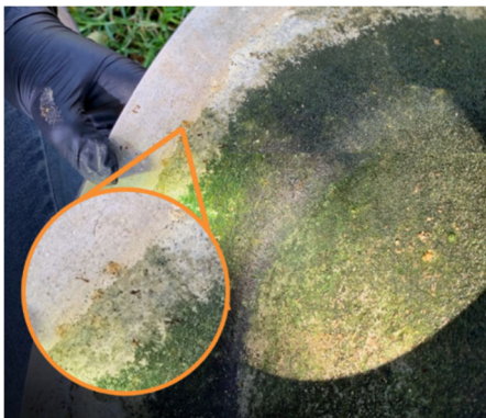
( Huevo de Aedes aegypti visto a simple vista)